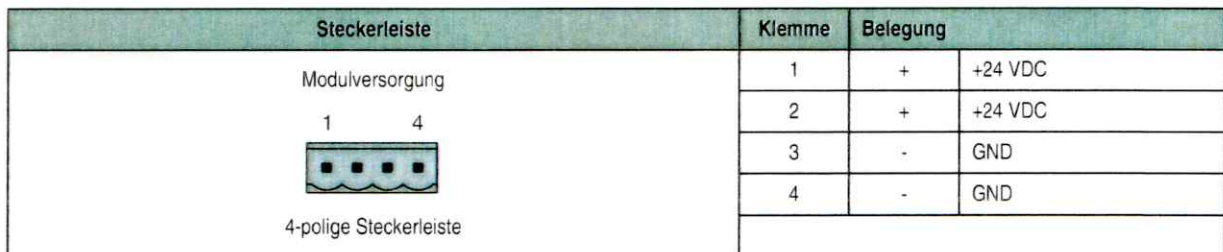
Tabelle 8: AK810 Modulversorgung

Der Umsetzer AK810 wird mit 24 VDC versorgt. Sowohl beide + als auch beide - sind intern miteinander verbunden.